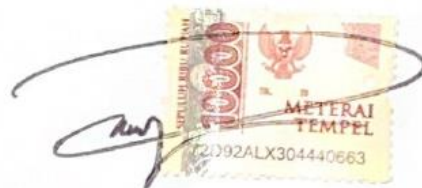
Indra Lesmana 20200510008