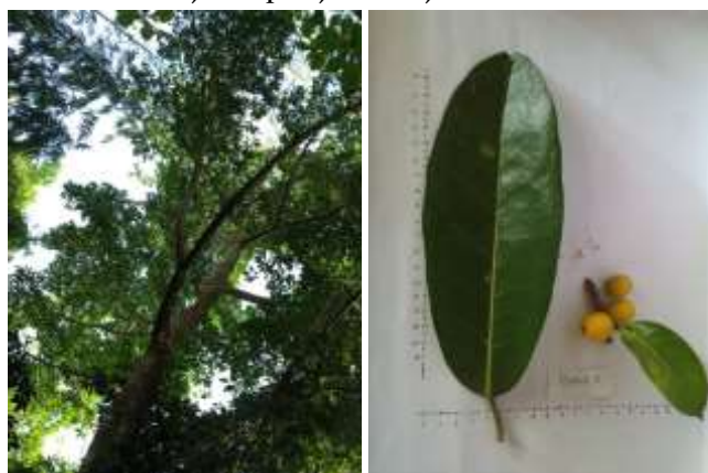
Gambar 2. Pohon Kiara bunut ( Ficus virens ) daun dan buah

Keterangan: P_i = Jumlah individu jenis per jumlah jenis